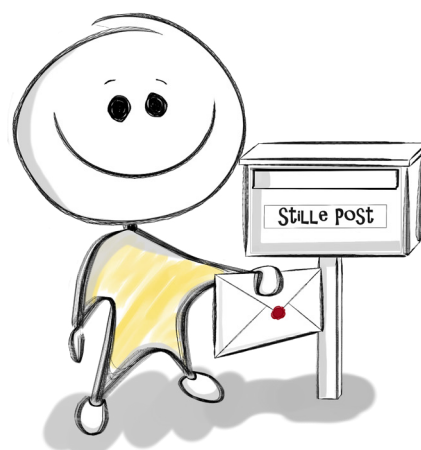
Grafikdesign: Helen Palm